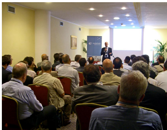
un pubblico attento ha seguito il

Altrettanto affascinante è il tema dell'espansione della televisione alle nuove frontiere di internet. Al pari dei pionieri che avevano colonizzato il selvaggio West, broadcasters, providers e manufacturers guardano a tali nuovi territori comunicativi con la speranza di ripetere in essi i successi conseguiti in passato con le transizioni dal bianco/nero al colore e, più di recente, all'alta definizione.